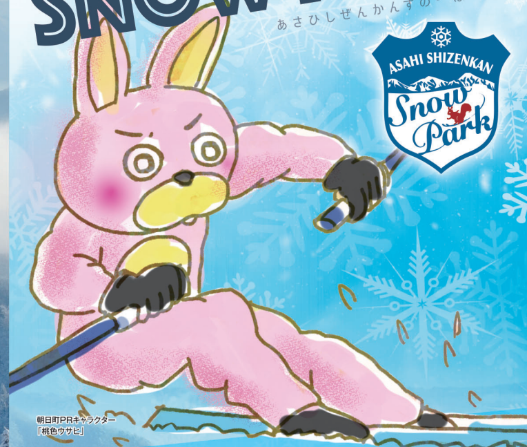
朝日町PRキャラクター「桃色ウサギ」